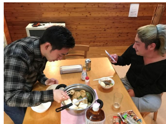
おでんやお茶漬で舌鼓を打ちました