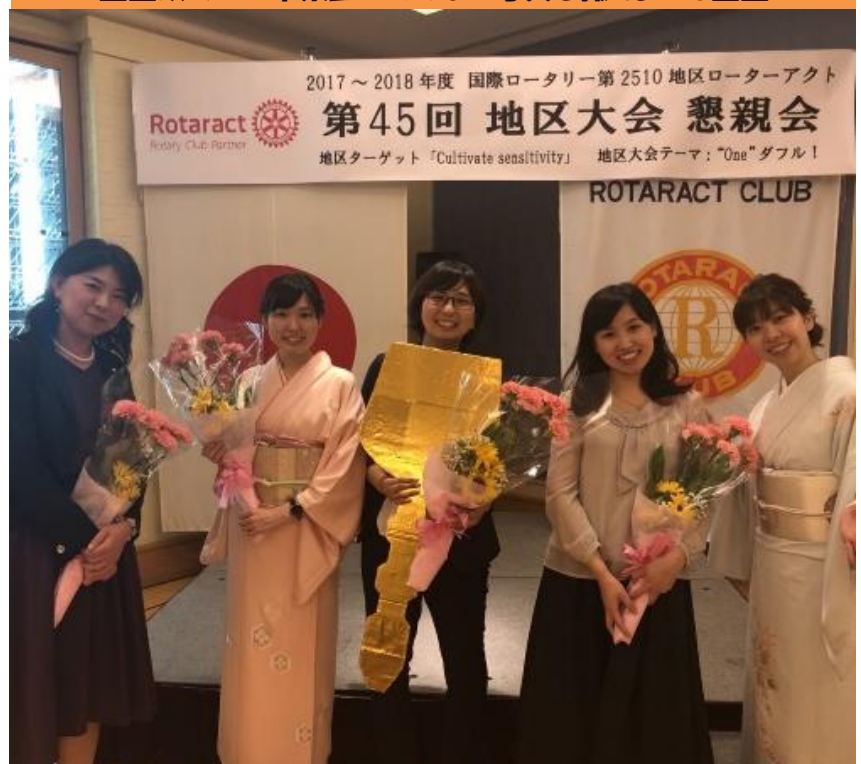
■改めて…卒業生のみんなで写真を撮りました■