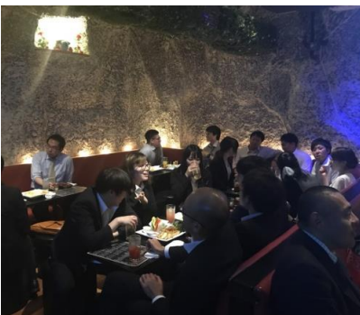
二次会の様子…その1