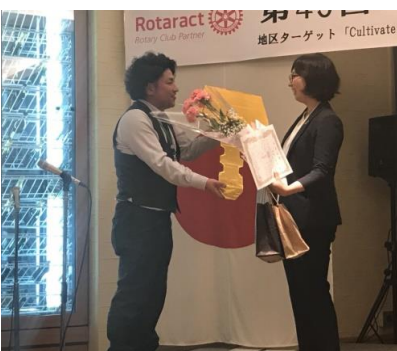
無事、サプライズ成功！