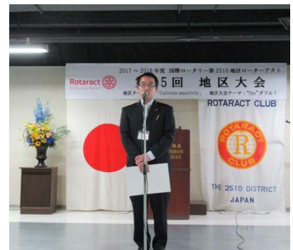
佐々木会員の喜びの声