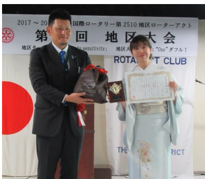
川下地区RA委員長と一緒に