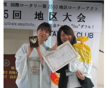
今年は写真を撮りまくりました