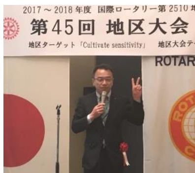
西方地区青少年奉仕委員長の締めの乾杯