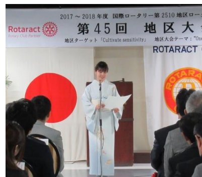
見事なリーダーシップでした