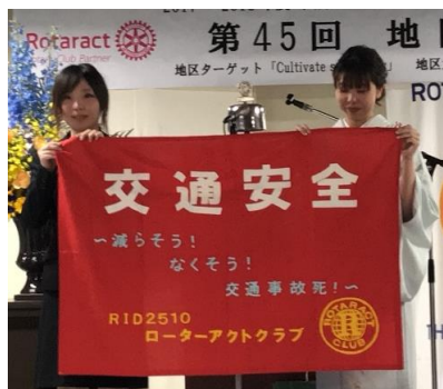
次年度は自転車リレー実施！