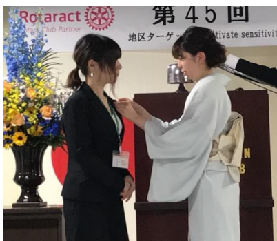
地区代表バッジの引継ぎ

最後、山下地区代表が涙ぐみながら点鐘し、式典が終了しました。ご参加いただいた皆様に感謝申し上げます。ありがとうございました。