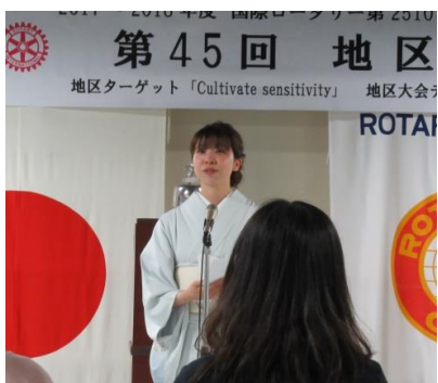
山下さんから皆さんへ…