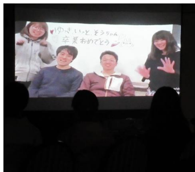
札幌幌南RACからは感動のメッセージ