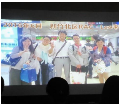
お祝いムービー上映中

卒業生入場後、卒業生へ感謝の気持ちを込めた「お祝いムービー」を上映しました。これまでの活躍の様子を写した写真や、各クラブからのお祝いメッセージも上映し、卒業生は感極まった様子でした。お祝いムービーはYoutubeでご覧できますので、ぜひご覧ください。