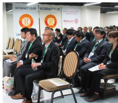
道外各地区のアクター