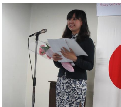
蔡さんから皆さんへ…