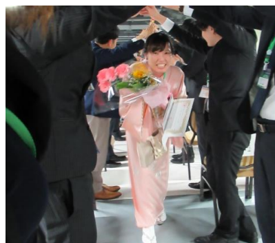
道外各地区のアクター