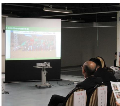
様々な行事に参加しました