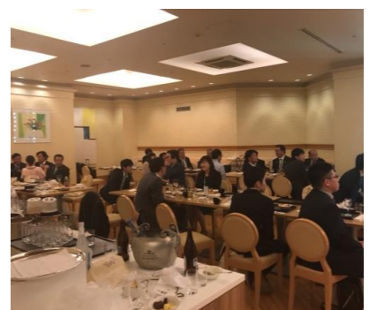
楽しい時間を共有できました