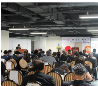
深貝地区広報による活動報告