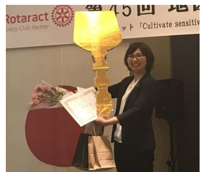
めめちゃん、喜んでくれました