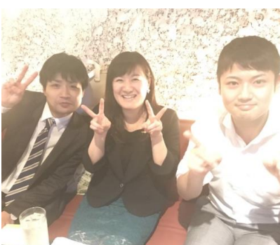
二次会の様子…その2