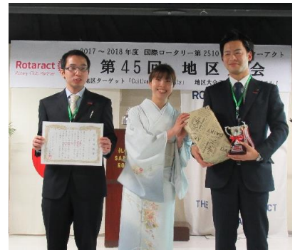
キレートレモンは飲みましたか？