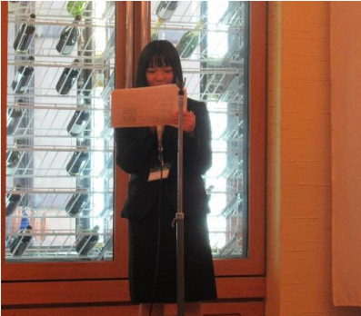
司会の北口地区広報

途中、各地区PRタイムを行い、参加各地区によるユーモアのあるPRが行われました。各地区PRタイムの最後には恒例(?)の、お土産でいただいた日本酒を嗜む場面もあり、参加者同士の親睦がさらに深まったと思います。