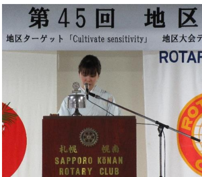
山下地区代表の挨拶