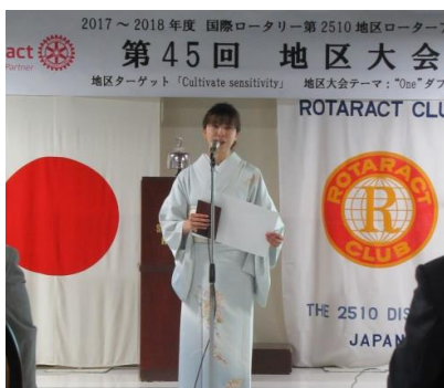
本当に1年間お疲れ様でした