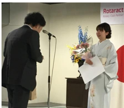
武田くんからの贈る言葉