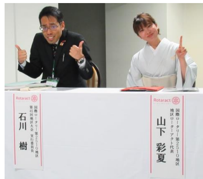
2年ぶりのコンビです