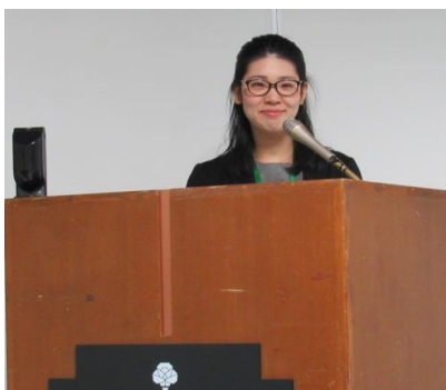
名司会ぶりに注目！！