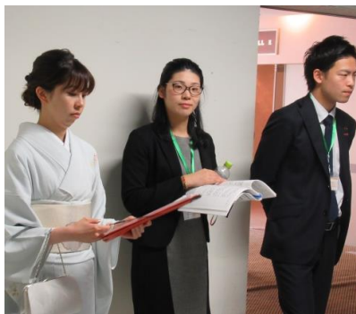
1年間地区を引っ張りました