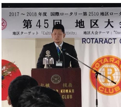
川下地区RA委員長のご講評