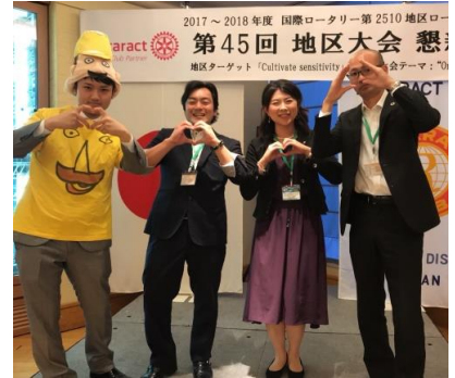
道外各地区の濃い皆様と(笑)