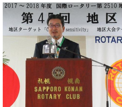
福田ガバナーノミニご挨拶