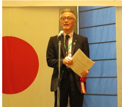
石山地区代表幹事の乾杯のご発声