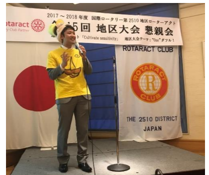
北海道でもおなじみのレルヒ