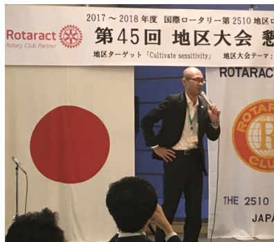
みんなのHero、じゅんじゅん