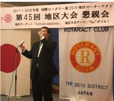
良い飲みっぷりですね☆