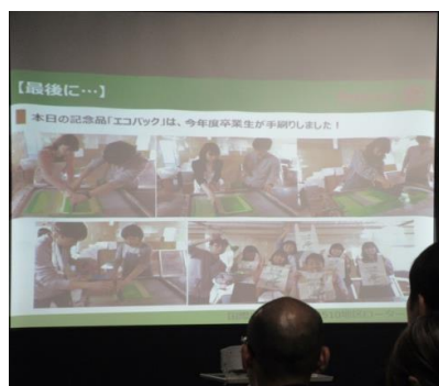
エコバックは卒業生が作成