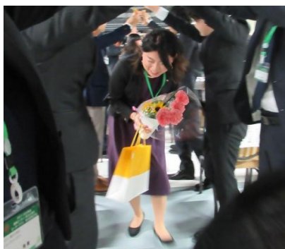
名司会ぶりに注目！！