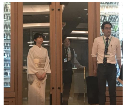
何やらコソコソと準備中…