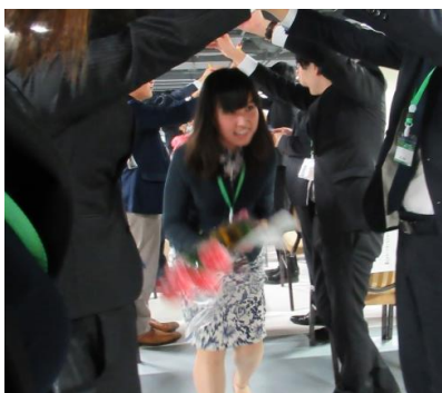
山下地区代表による点鐘