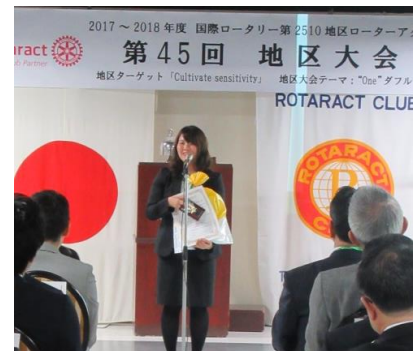
次年度も地区広報を務めます