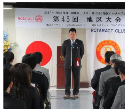
川下地区RA委員長から授賞理由発表