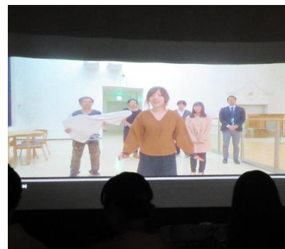
「赤平の本気」を魅せます！