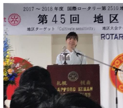
山下地区代表涙の点鐘です