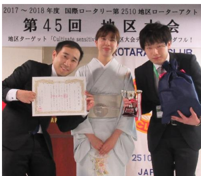
実行委員長の好物が副賞です