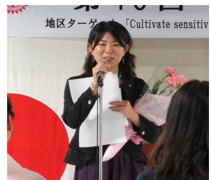
三浦さんから皆さんへ…