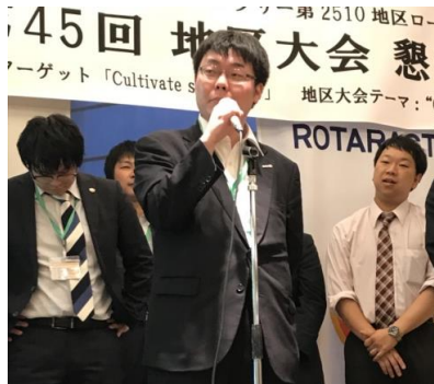
今年の北海道交流会は稚内！