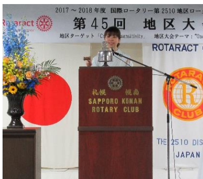
山下地区代表による点鐘