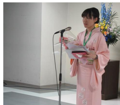
伊東さんから皆さんへ…