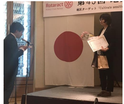
鈴江くんから感謝の言葉