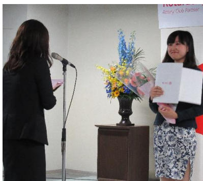
深貝さんからの贈る言葉