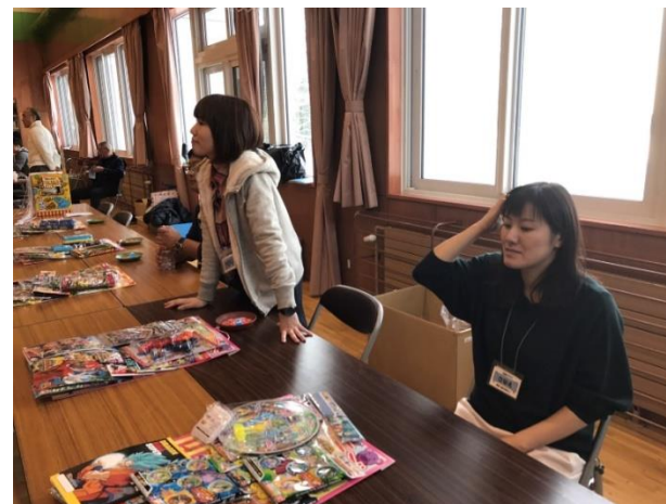
子供たちが引きにくくじ引きの手伝い