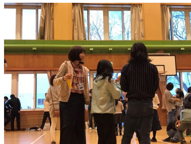
子供たちとレクリエーションも行い、交流