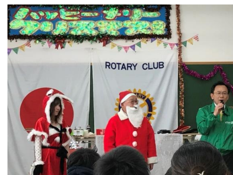
サンタの秘書役として登場した小野寺会員