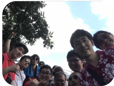
Hafa Adai ②