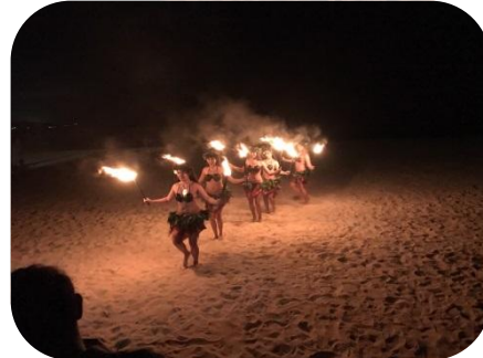
ファイヤーダンス