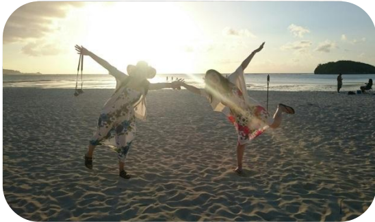
やっとビーチ来ました