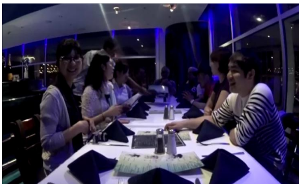
思い思いの肉料理を満喫するメンバー

4時間の飛行、慣れない入国審査を無事すませ、常夏の楽園、グアムにたどり着き、さっそく夕食を摂るべく、SEA GRILLというお店にやってきました。