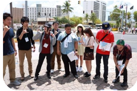
暑さでお疲れです…