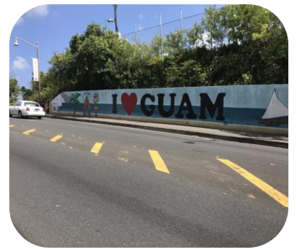
全国研修会のプログラム中に撮った街並みの様子