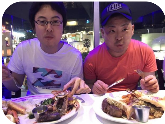
もぐもぐ。満足な顔