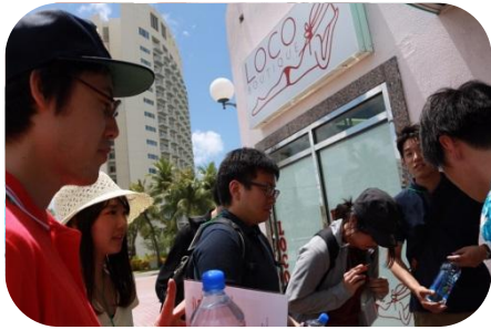
質問に答えている様子