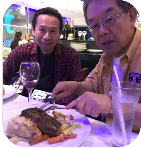
たのしそう( ͡° ͜°)