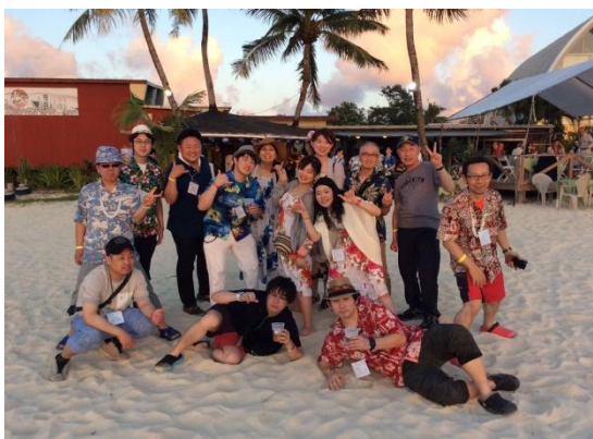
会場の砂浜で写真を撮る 2510 & 2500 の皆さん。

バスで異国情緒感じる街並みを走り、民家の裏のような道を抜けると、そこには夕日が美しいビーチが現れました。