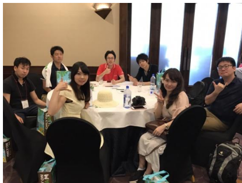
↑グループ3のメンバー

その後はJimmy Dee's Beach Barで懇親会。開放感溢れる野外ビーチでアクターの