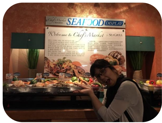
めめちゃん、選ぶの悩んでた！