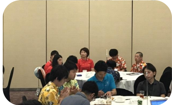
2500 地区と 2510 地区