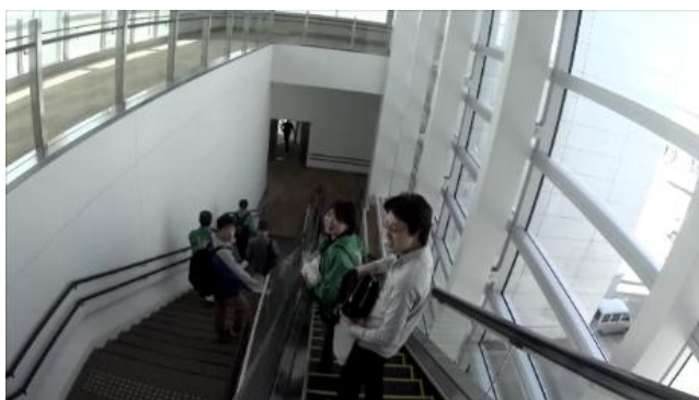
飛行機に搭乗せんとするメンバー。

今回初めての海外で行われる研修のため、4/14 新千歳空港に集った2510地区メンバー。海外旅行に慣れているメンバーをよそに、私はどこか初めての海外旅行に不安を抱えていました。しかしそれ以上にグアムという地への魅力と、心強い仲間たちとの旅という事実が楽しい旅になる確信を持たせてくれました。