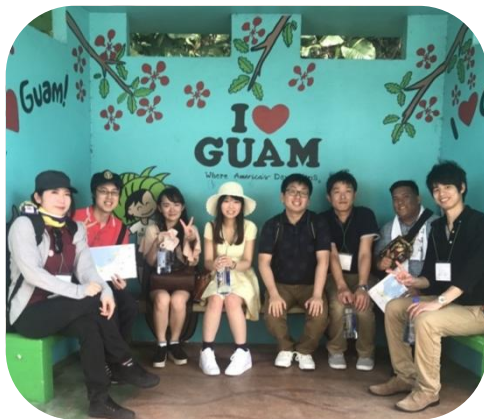
グアムのバス停にて休憩