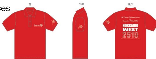
製作したアクト活動ポロシャツ