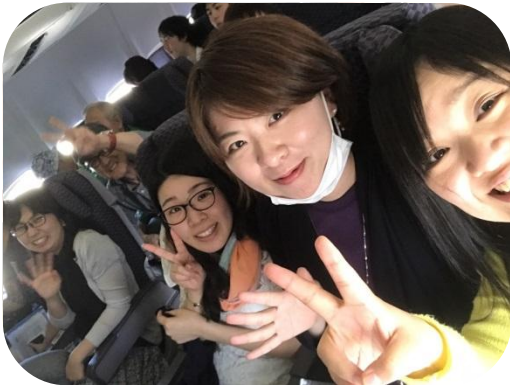
到着前のドキドキ♡