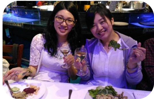
シャンパンとステーキ…幸せ～