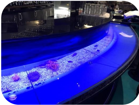
レストラン内のカウンター席