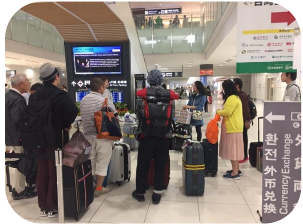
解散!! お疲れ様でした☆