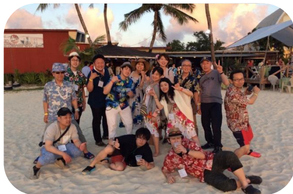
2500 地区♥2510 地区