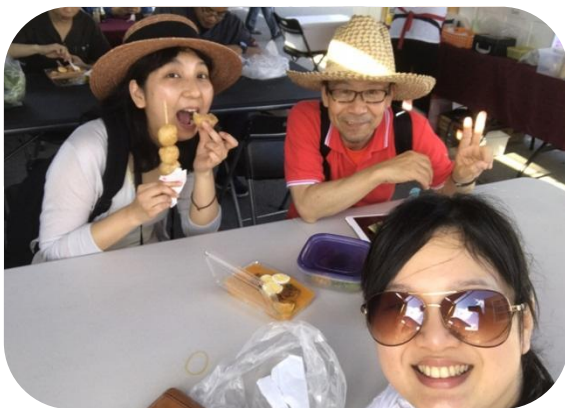
こんな朝早いのに元気！