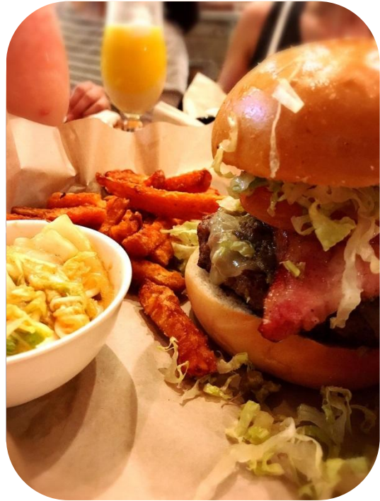
とてもボリュームミーなハンバーガー