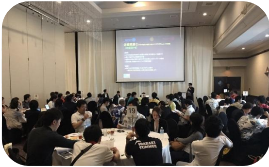
2700 地区がプレゼンテーションしている様子