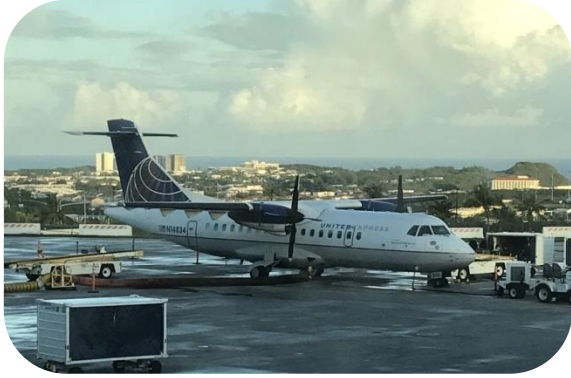
最終日も天候に恵まりました