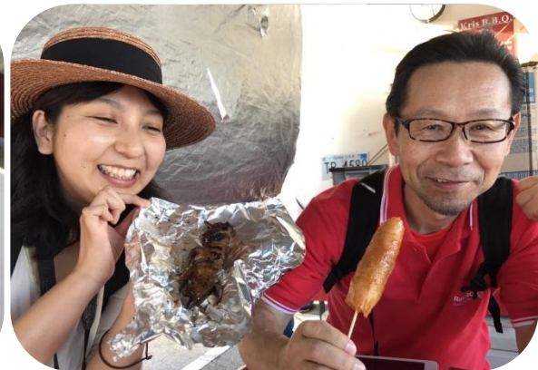
おいしそうですね～