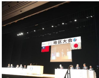
開会式が始まりました