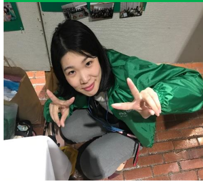
一生懸命写真を貼っていました