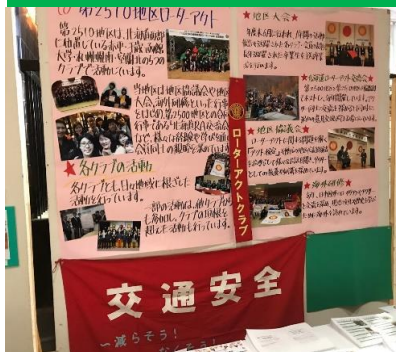
交通安全の取り組みもPR