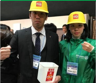
北海道交流会でも頑張るぞ！