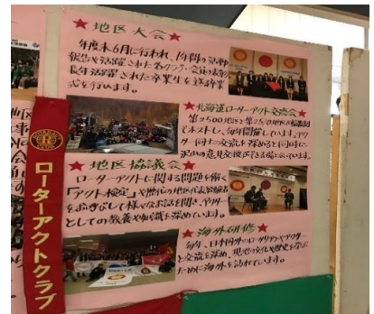
各行事についての説明