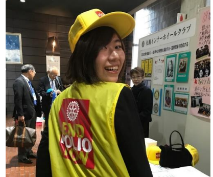
後ろからでもPRしています