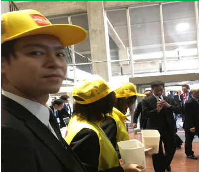
入り口側のスペースで実施