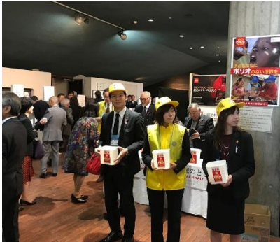
3名でポリオ募金を行いました