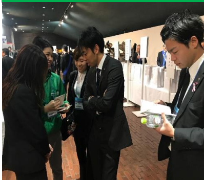
事前打ち合わせ中...