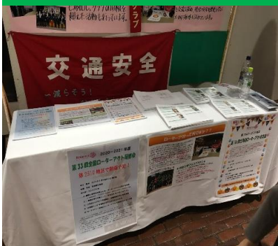
北海道交流会PRポスターです