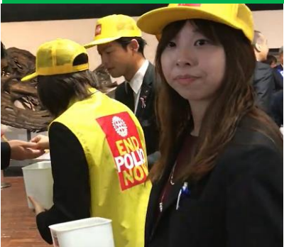
募金のお礼にポリオバッジ