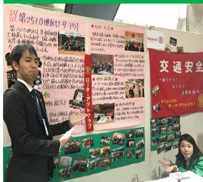
完成を喜ぶ地区幹事・地区副代表