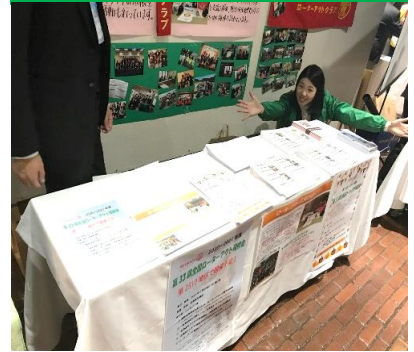
閲覧用の書類もそろえました