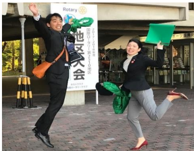
中1週での函館訪問です！

函館ロータリークラブがホストのもと行われた「国際ロータリー第2510地区大会」に参加しました。これだけの大きな規模の会をととも円滑に執り行ったり、事前の打ち合わせやコ・ホストクラブとの協力体制は素晴らしいものでした。ローターアクトでこれらを活かせるよう努めたいと思います。