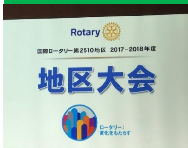
立派なプレゼンです！