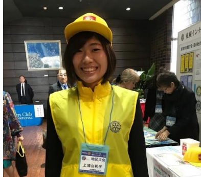
ポリオのジャケット・帽子着用