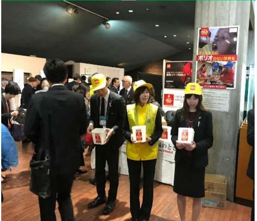
ポリオ募金にご協力ありがとうございました！