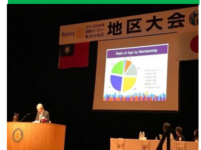
姚RI会長代理の現状報告