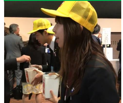
午前だけで目標金額達成しました