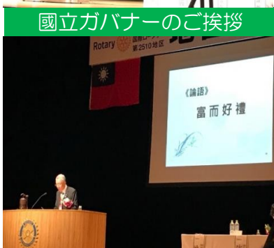
上手な日本語でのご報告