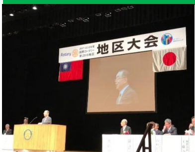
国立ガバナーのご挨拶