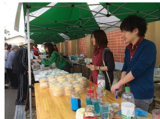
出店のお手伝いの様子。