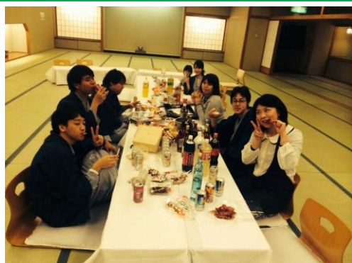
みんなでお酒を飲みながら語りました！③