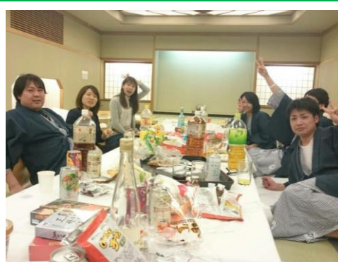
みんなでお酒を飲みながら語りました！④