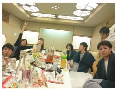
みんなでお酒を飲みながら語りました！②