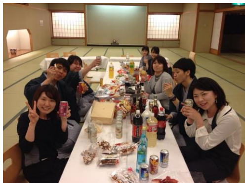
みんなでお酒を飲みながら語りました！①