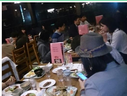
みんなで夕食バイキング