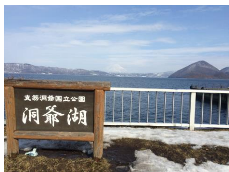
温泉で洞爺湖を一望しながら語りました