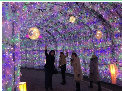
街中にはたくさんのイルミネーションが！