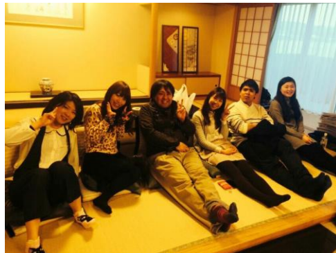
広いお部屋で、とっても快適でした！