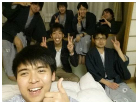
温泉で洞爺湖を一望しながら語りました