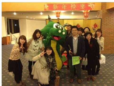
みんなでいい思い出を作って帰ってきました