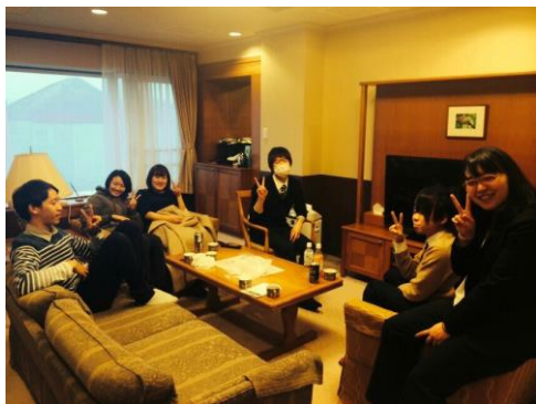
みんなホテルに到着しました！

今回の温泉交流会は、洞爺湖町にある「洞爺湖万世閣 ホテルレイクサイドテラス」に宿泊しました。全員で約 20 名の参加をいただき、当地区のアクター同士の親睦を深めました。今後のアクトについての話もしたり、楽しい話をしたりと、有意義な 2 日間を過ごすことができました。今回交流をさらに深めることができたので、今後のアクト生活に生かしていきたいと思います。