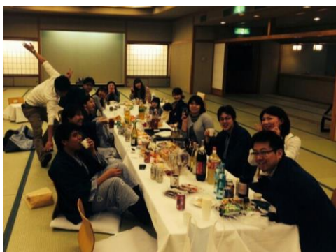
気づけば、日付が変わってました。